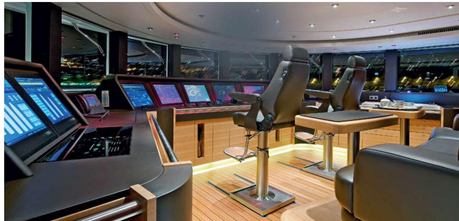
В ТЕХНИЧЕСКОМ РЕШЕНИИ ЛОДКИ НАЙДЕНА ТА ЗОЛОТАЯ СЕРЕДИНА, КОТОРАЯ ПРИМИРЯЕТ МОЦЬ С КОМФОРТОМ

С первого взгляда видно, что все пространства представляют собой единую композицию, в которой использованы благородные натуральные материалы: дуб со вставками зебрано и венге, кожа, плетеный бамбук.