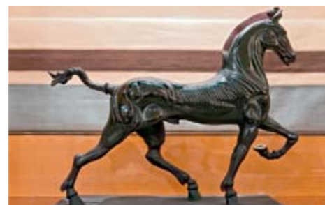
Слева Статуэтка гарцующего коня в стиле ар-деко украшает офис владельца. Справа В норвежских фьордах Bel Abri чувствует себя столь же уверенно, как и на Средиземноморье.

Полгода прошло между презентацией Bel Abri в норвежских фьордах и показом на бот-шоу в Монако. За это время суперяхта успела получить самые лестные отзывы экспертов и прессы, что еще раз подтвердило успех совместного проекта верфи Amels и компании Imperial . Опыт уже состоявшихся чартеров показал, что Bel Abri , построенная на голландской верфи Amels , приспособлена практически к любым условиям, одинаково хорошо себя чувствует и в северных морях, и на Средиземноморье. В ближайшее время ей предстоит трансатлантическое путешествие в направлении Карибских островов. И эта задача будет решена с легкостью – при скорости в 13 узлов Bel Abri способна пройти 4500 миль без дозаправки. Просторная планировка Bel Abri оставляет воздушное впечатление, при этом не лишенное интимности, что делает яхту крайне привлекательной для чартера. Здесь не сэкономили место и не старались вписать как можно больше помещений. Напротив, яхта запоминается открытыми, легко трансформирующимися пространствами: сверкающий полировкой салон соединяется со столовой на основной палубе, раздвижные двери на нижней палубе также легко распахиваются,